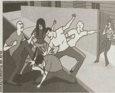
Grupo espanca a vítima do lado externo. Ameaçada de morte, irmã dela fica na porta sem nada poder fazer