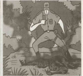
Policial militar percorre trilha através de vegetação densa e acha corpo da vítima parcialmente carbonizado

çaram também matá-la caso tentasse impedi-los.