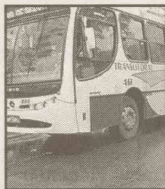
Ônibus não passam